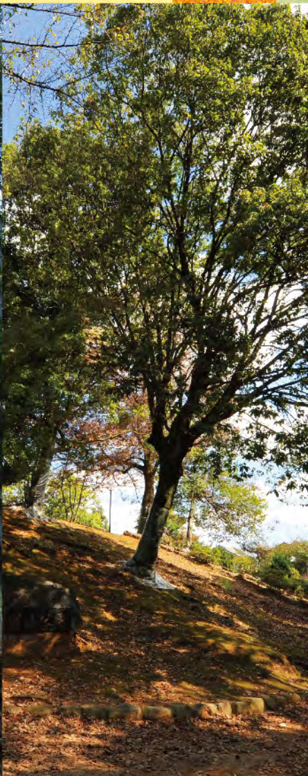
左から物集女車塚古墳、竹の径、元稻荷古墳。左下、物集女車塚古墳玄室