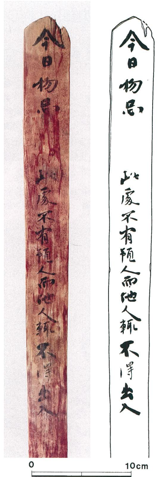
木簡の写真と実測図

「物忌」 ものいみ とは、貴族たちが暦や占いの凶日や悪夢を見たときなどに、災いを避けるため数日屋敷にこもって身を慎むことで、物忌札を門外に立てて来客の立ち入りを禁じました。この木簡は、長岡京左京三条三坊一町の南を区画する溝から出土しました。大きさは全長110.4cm、最大幅4.3cm、厚さ0.7cmで、年代が確定できる最古の物忌札です。上端部は圭頭状、下端部は剣先状に加工されています。上端部に打撃痕や結縛痕はなく、下端部の遺存状況をもても打ち込まれた形跡はみられません。宅地南門の外側に掘った穴に埋めるか、盛り上げた土にさしこんで使用したと推定されます。表側だけに、「今日物忌」、少し間をあけて「此處不有預人而他人軌不得出入」と記されています。「今日、(当家の主は)物忌で(こもっています)。この場所(南門)に預人(家の用件を預かる者)はいませんが、他人(来客)はたやすく(わけもなく)出入できません」と読むことができます。上の四字は下の文字の倍の大きさを書かれ、「今日は物忌」であることを強調しています。