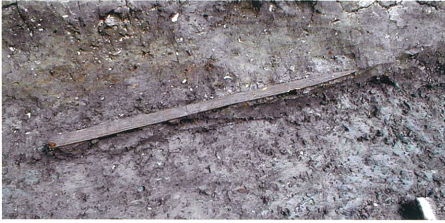
三条条間北小路北側溝SD42809：木簡の出土状況（南から）