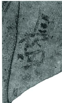
「長岡」と記された7世紀後半の須恵器