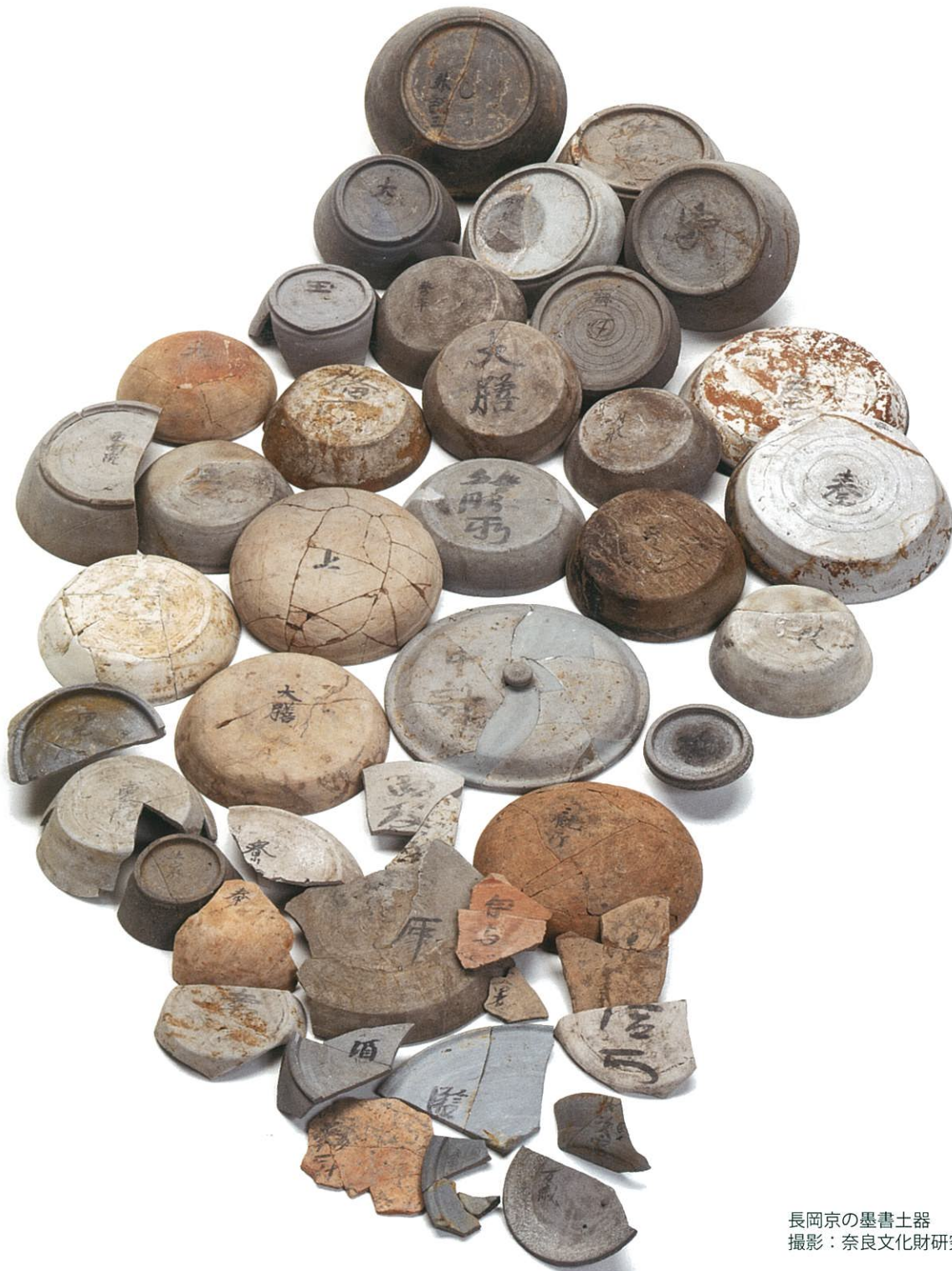
長岡京の墨書土器